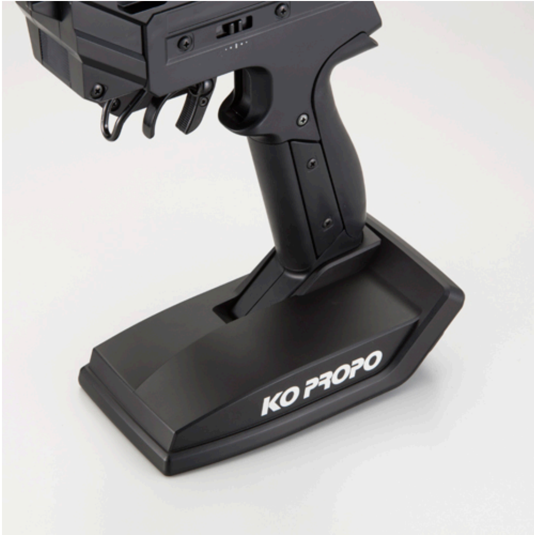
EX-1 KIY tiefergelegtes Lenkrad