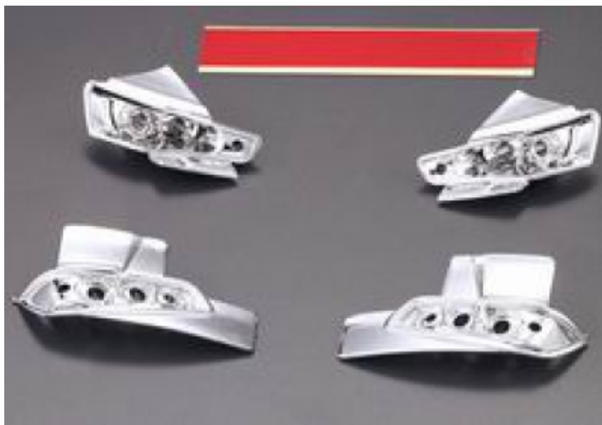
KB48188 - Mitsubishi Lancer Evo X - porta LED