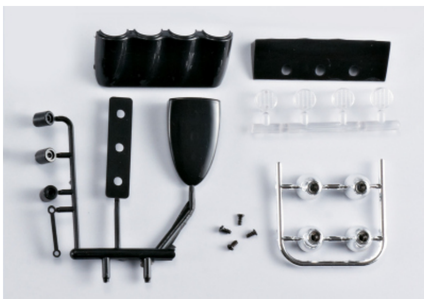
KB48058 - Mitsubishi Lancer Evo X - pezzi in plastica per l'estetica.