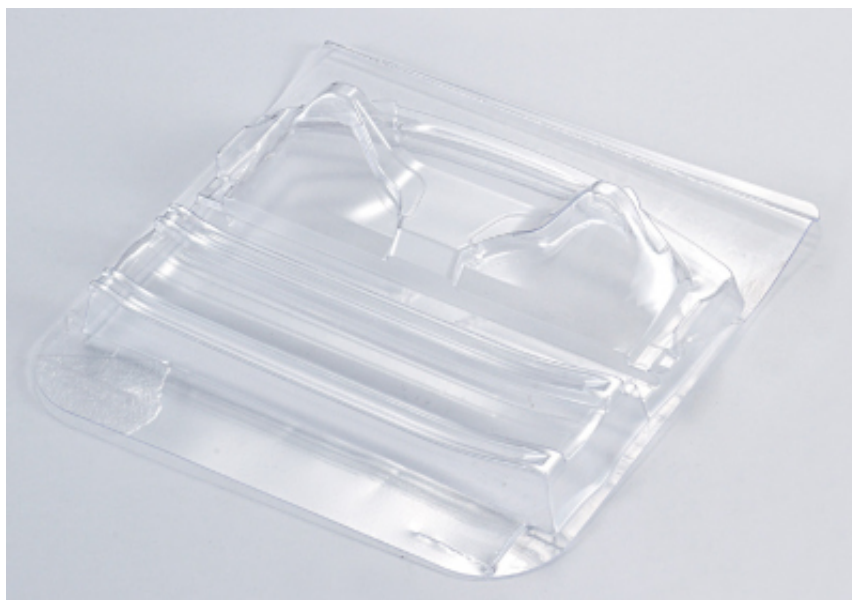
KB48008 - Mitsubishi Lancer Evo X - Body Kit