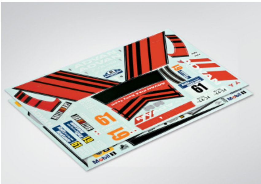
KB48007 - Adesivi Mitsubishi Lancer Evo X