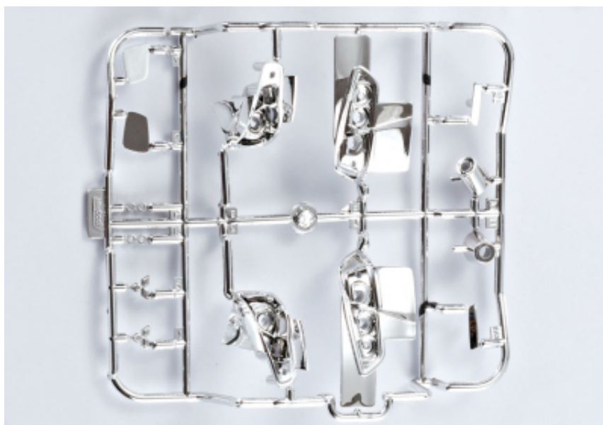
KB48009 - Mitsubishi Lancer Evo X - Set completo di (retrovisore, fanali, marmitta)