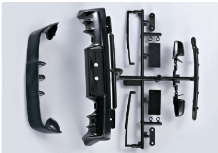
KB48010 - Mitsubishi Lancer Evo X - Set completo (paraurti, tergicristalli, retrovisore, targa)