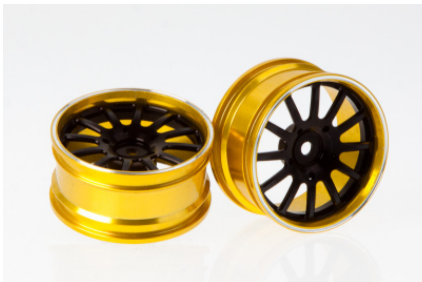
KB48075 - Cerchi in'alluminio "Alloy"