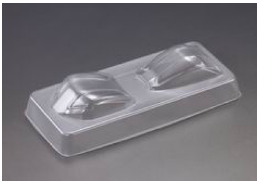
KB48096 - Mitsubishi Lancer Evo X - fanali